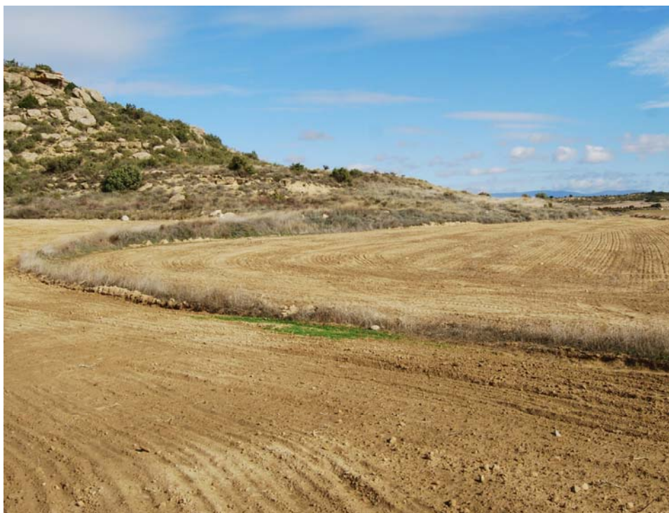
Ladera baja del Cabezo y campos de labor donde se localiza el material mueble.