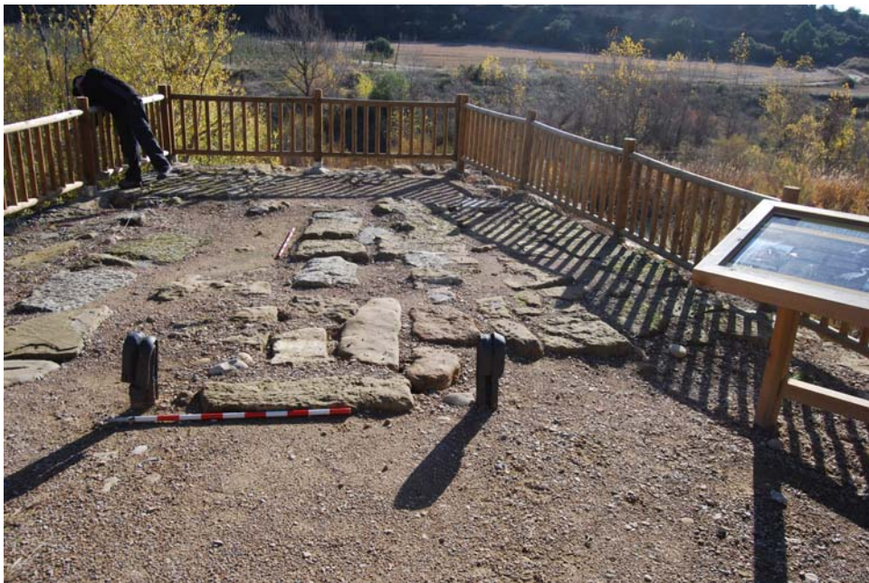
Parte superior del puente, se observan los ganchos de sujeción del puente de tablas.