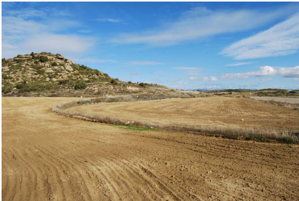
Vista general del yacimiento