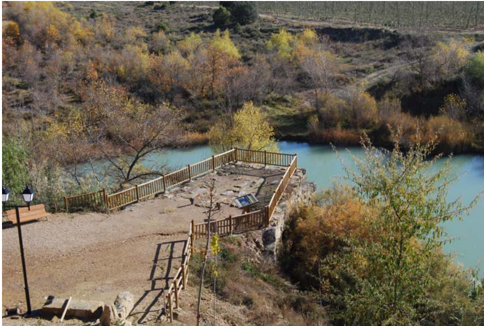
Aspecto actual de la parte superior del puente