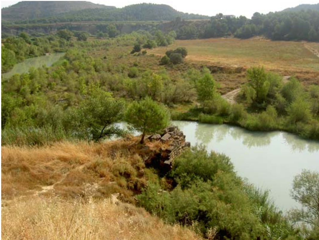
Foto del puente, antes de la remodelación