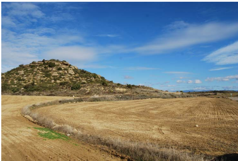
Vista general del yacimiento.